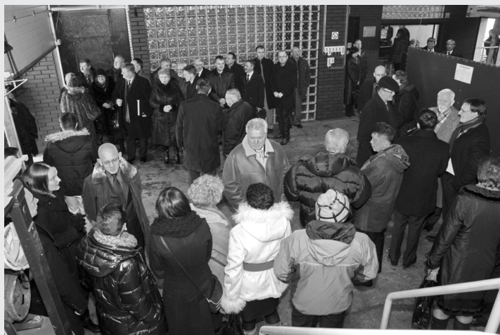
Goście na hali produkcyjnej Fluid S.A.