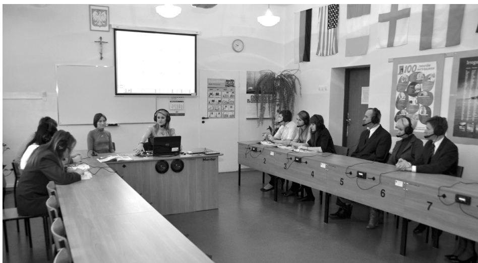
Prezentacja multimedialna przybliżająca możliwości laboratorium językowego

Nowa pracownia językowa w znacznym stopniu przyczyni się do zwiększenia atrakcyjności edukacyjnej Liceum Ogólnokształcącego w Sędziszowie. Umożliwi realizowanie nauki języków obcych w zakresie