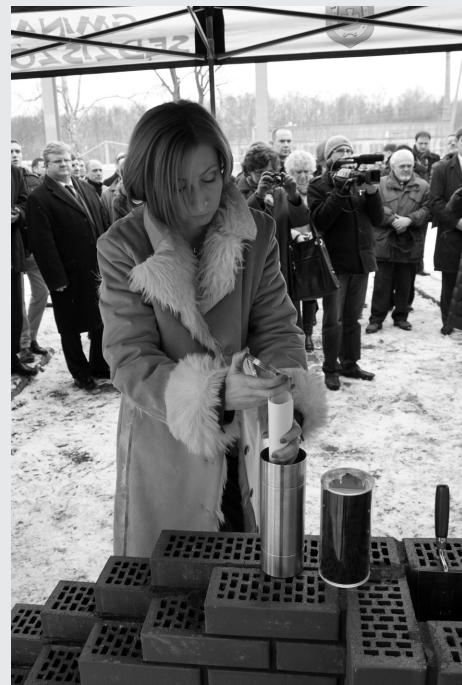
Umieszczenie Aktu Erekcyjnego