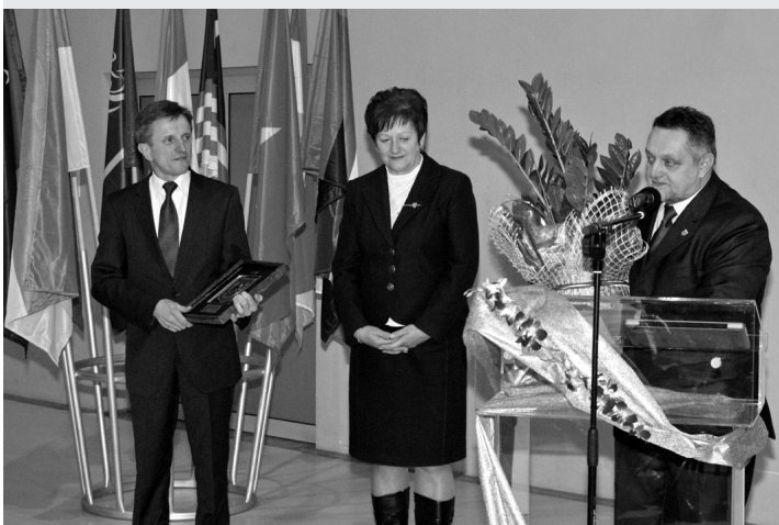
Delegacja władz lokalnych