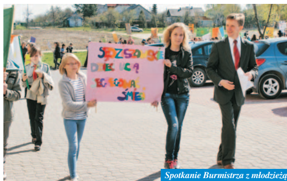
Spotkanie Burmistrza z młodzieżą