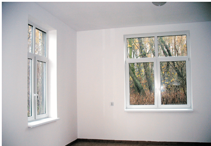
... i po remoncie