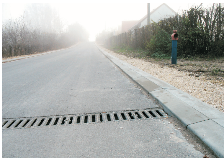
Ul. Kwiatowa po remoncie