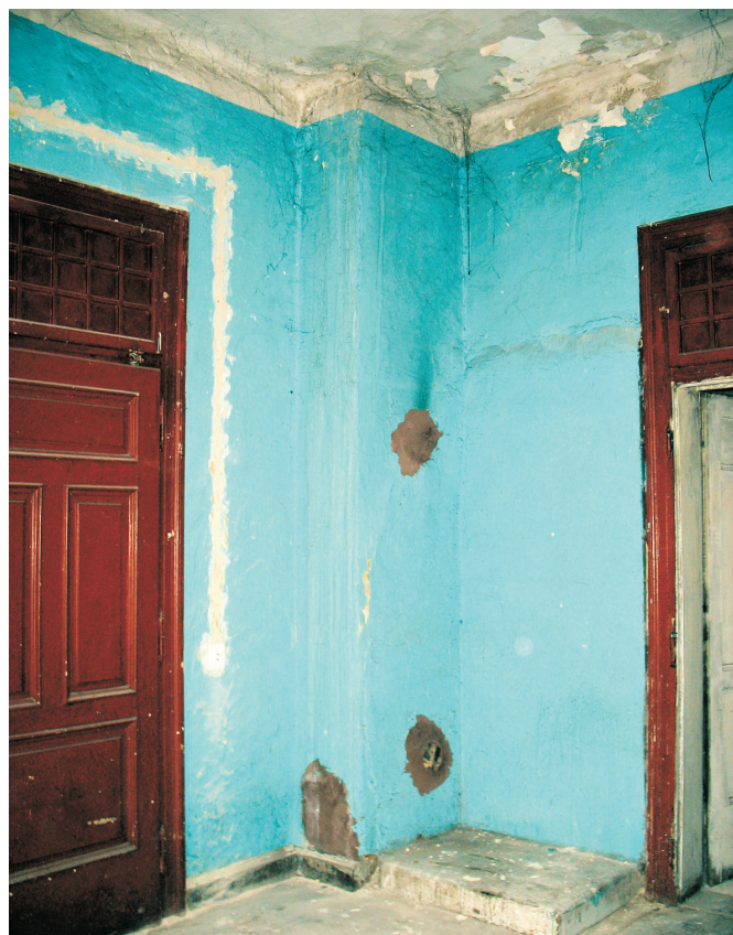
Stan przed remontem ...