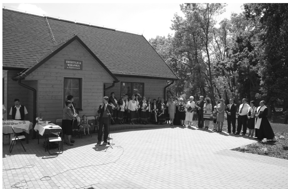
Otwarcie świetlicy wiejskiej w Pawłowicach