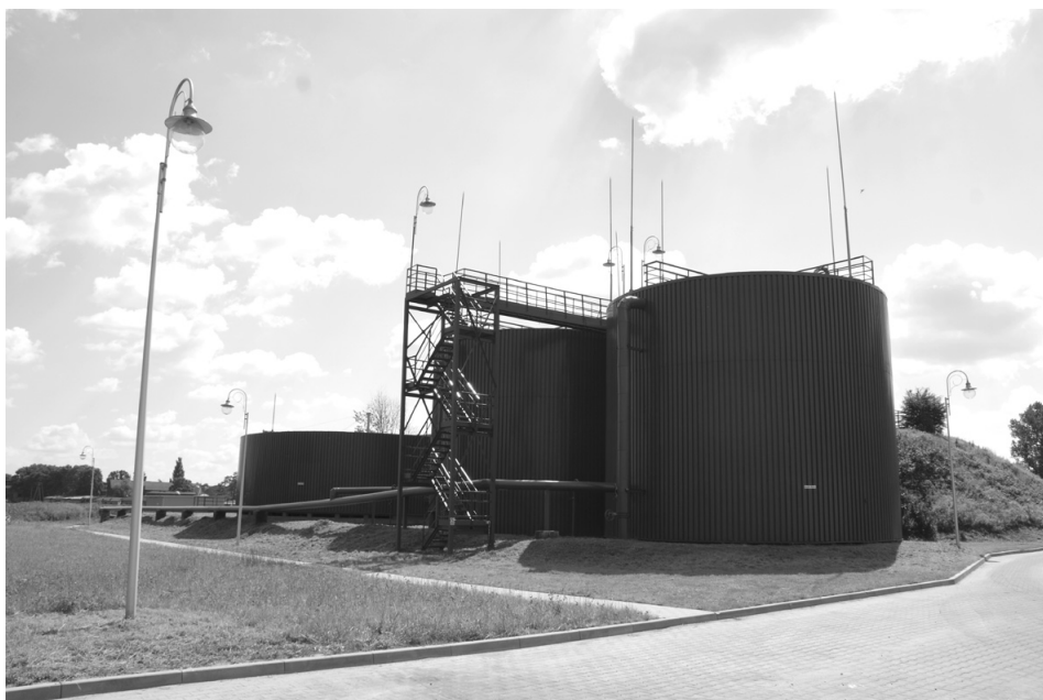
Oczyszczalnia Ścieków po modernizacji

gminy były drogi. W podsumowaniu w 2011 roku gmina wzbogaciła się o 14.156 mb nakładów bitumicznych z tego: