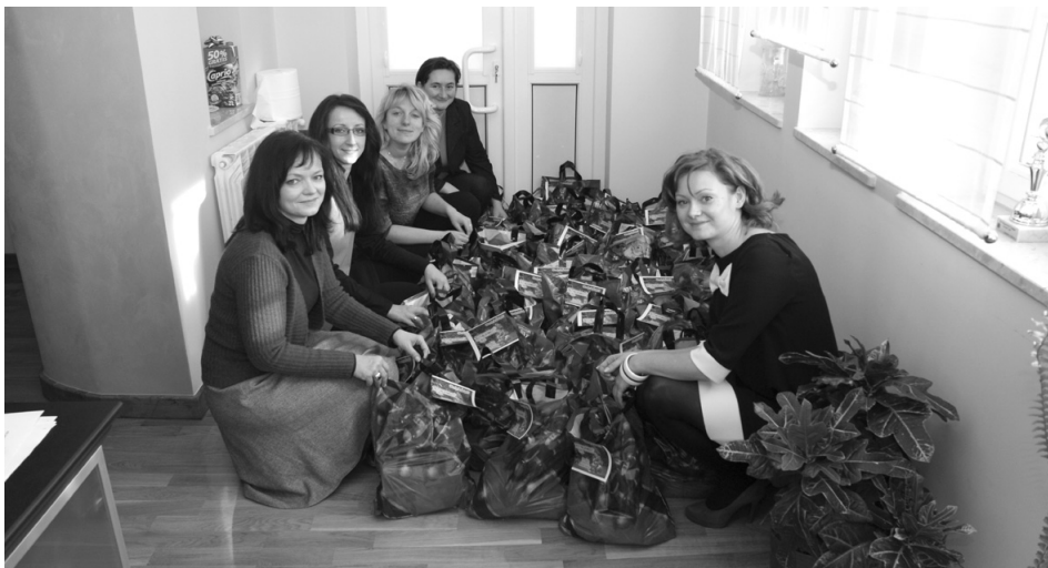
Pracownice Urzędu Miejskiego w Sędziszowie z połową paczek przygotowanych do rozdania