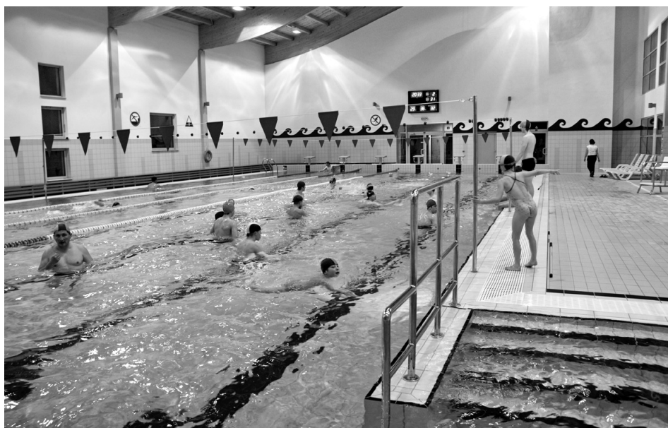
Basen w Ośrodku Sportu i Rekreacji w Sędziszowie

Na przestrzeni dwóch lat ubyło nam równo 100 uczniów (2009 - 1365 uczniów, 2010 - 1308 uczniów, a w 2011 - 1265 uczniów). Finansowanie oświaty to w skali roku 11,6 mln zł, otrzymana subwencja 7,8 ml zł, budżetu gminy 3,8 mln zł. W minionym roku przekształciliśmy poprzez likwidację Szkołę Podstawową w Mstyczowie. Obecnie jest prowadzona przez Fundację. Rada Miejska aktualnie podjęła uchwałę w sprawie