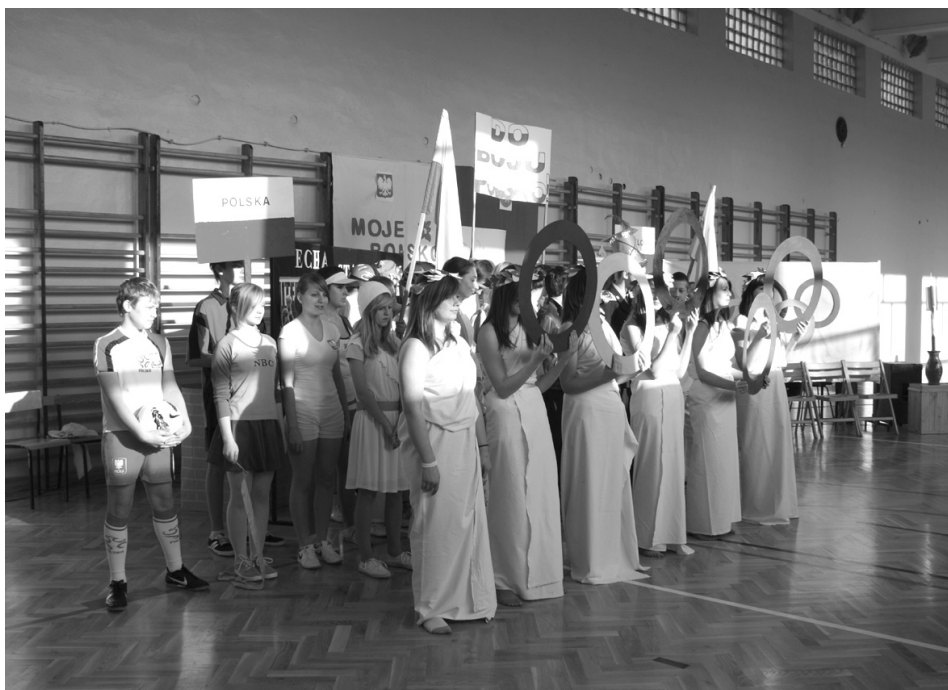
Występy młodzieży z ZSKCP w Krzelowie

podarz gminy, w której ZSCUP funkcjonuje, służąc społeczności regionu już 66 lat, podziękował na ręce p. Starosty za działania na rzecz tej placówki.