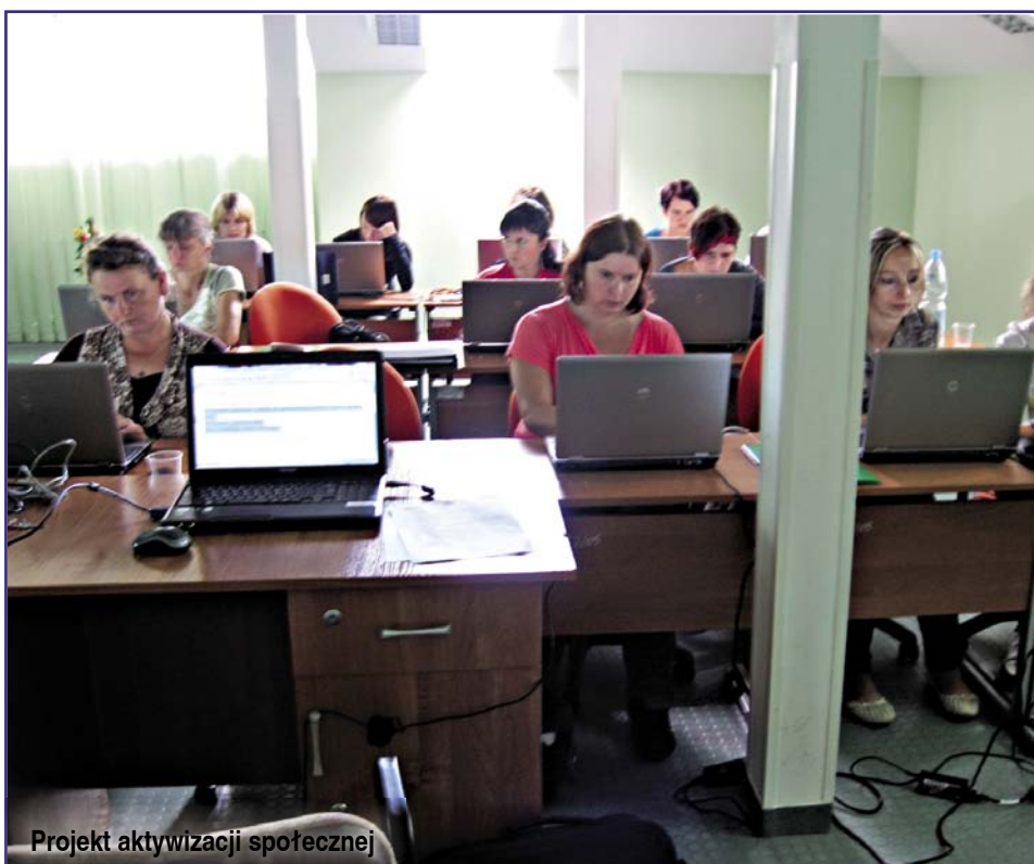
Projekt aktywizacji społecznej