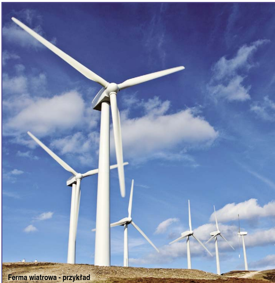
Ferma wiatrowa - przykład

Prowadzone są rozmowy biznesowe o umiejscowienie na terenie gminy takich inwestycji: rozbudowa terminalu przeładunkowego, fermy wiatrowe, fotowoltaiki, ferma drobiu i inne.