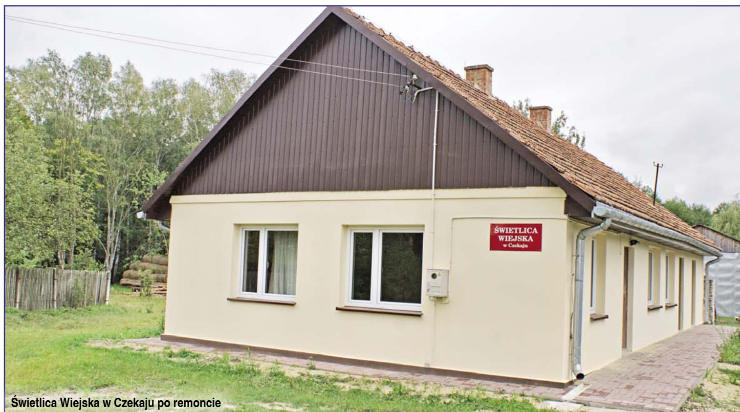
Świetlica Wiejska w Czekały po remoncie