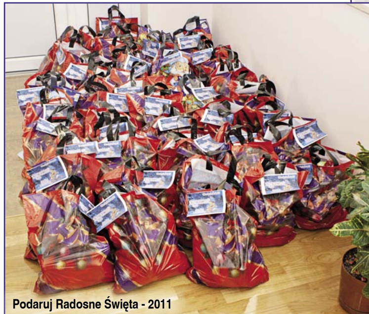
Podaruj Radosne Świąta - 2011