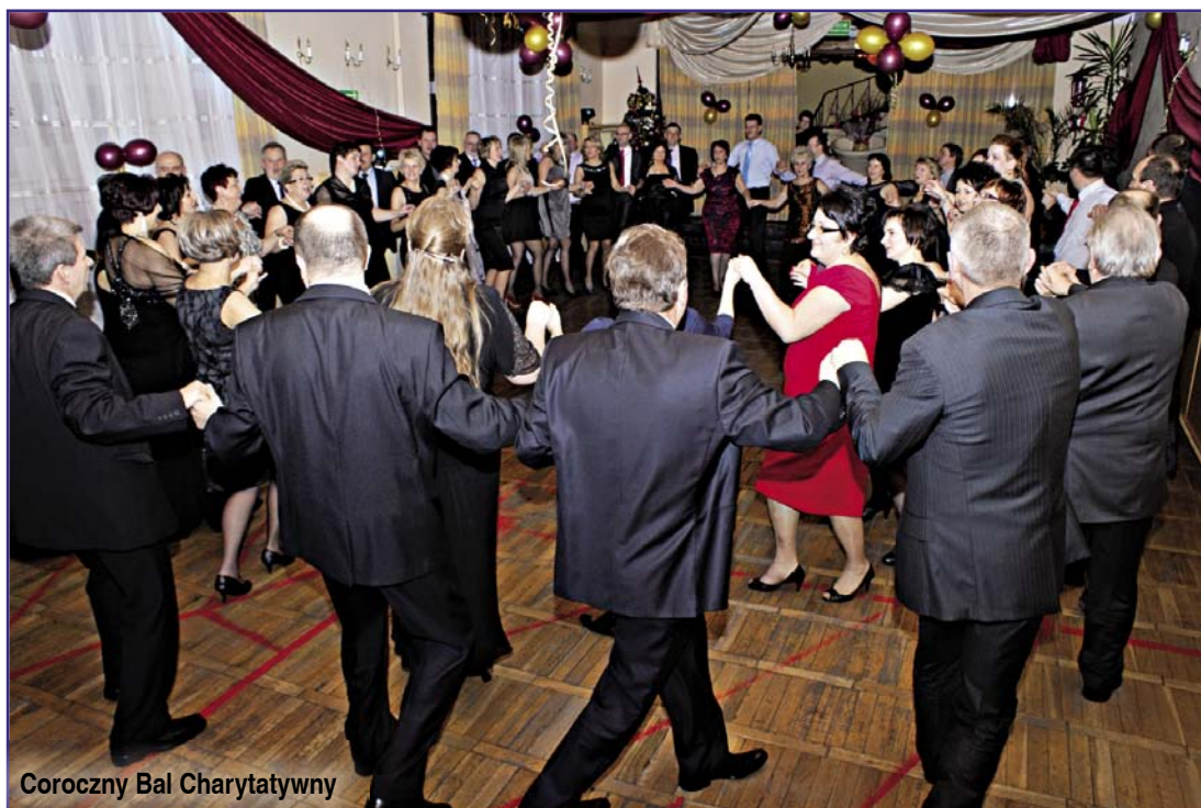
Coroczny Bal Charytatywny