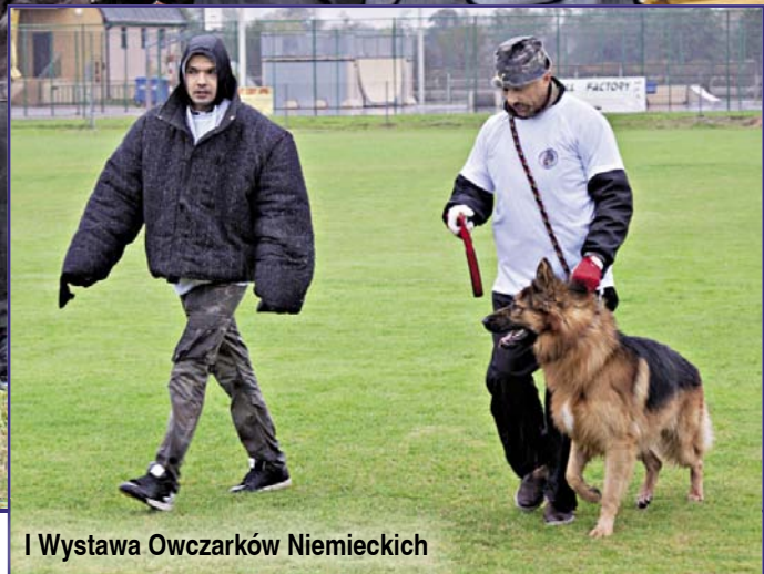
I Wystawa Owczarków Niemieckich