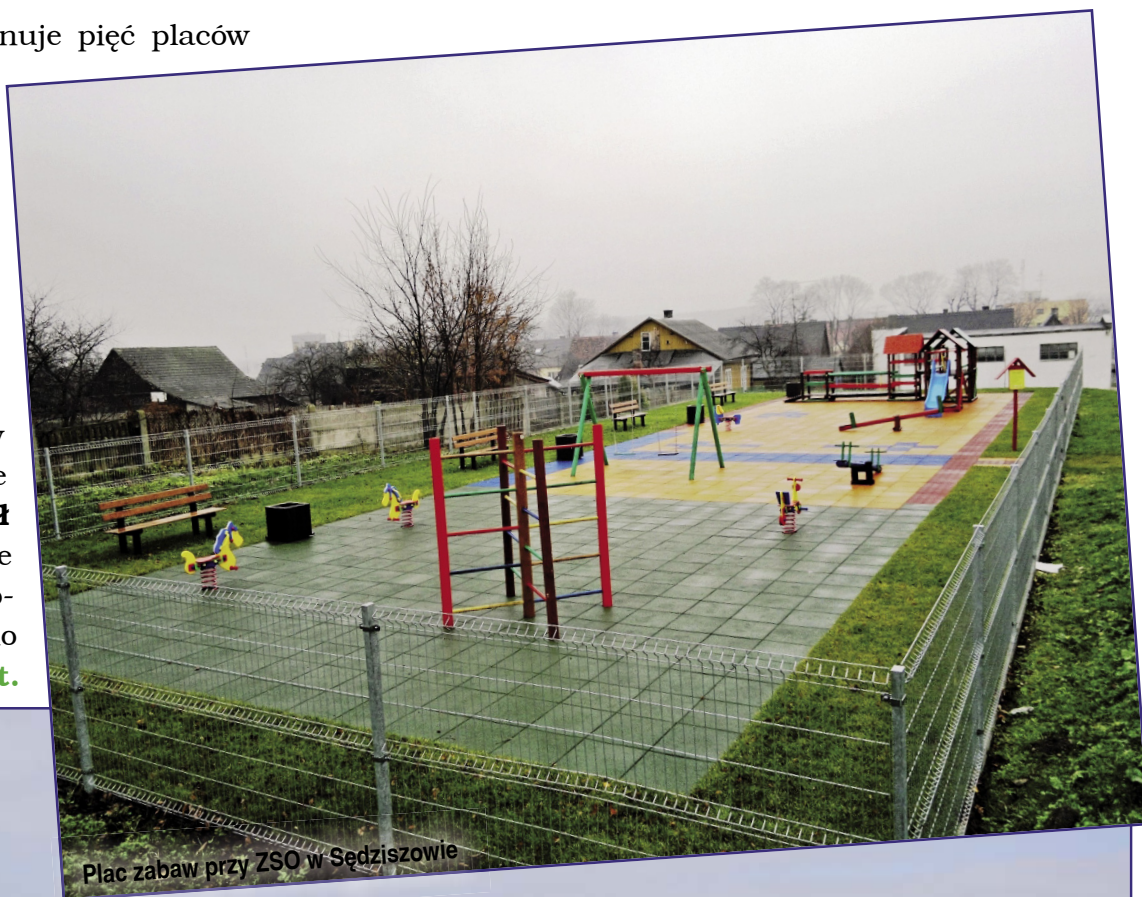
Plac zabaw przy ZSO w Sędziszowie