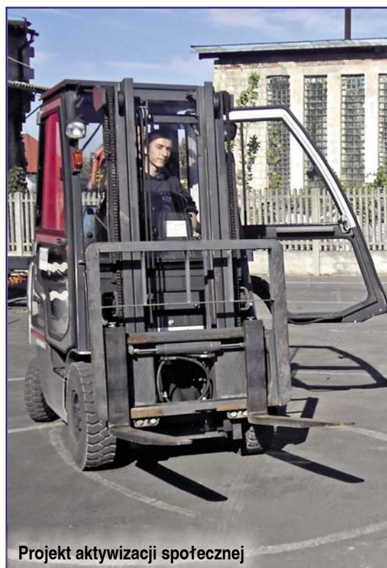
Projekt aktywizacji społecznej