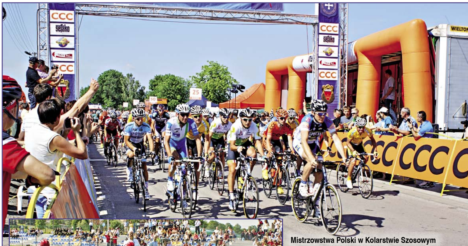
Mistrzostwa Polski w Kolarstwie Szosowym

Te tak duże, o krajowym zasięgu sportowe imprezy masowe ściągnęły do naszej gminy sympatyków sportowej rywalizacji w dużych, dużych rozmiarach. Czas tych zawodów był dla naszej gminy szeroką promocją o zasięgu krajowym.