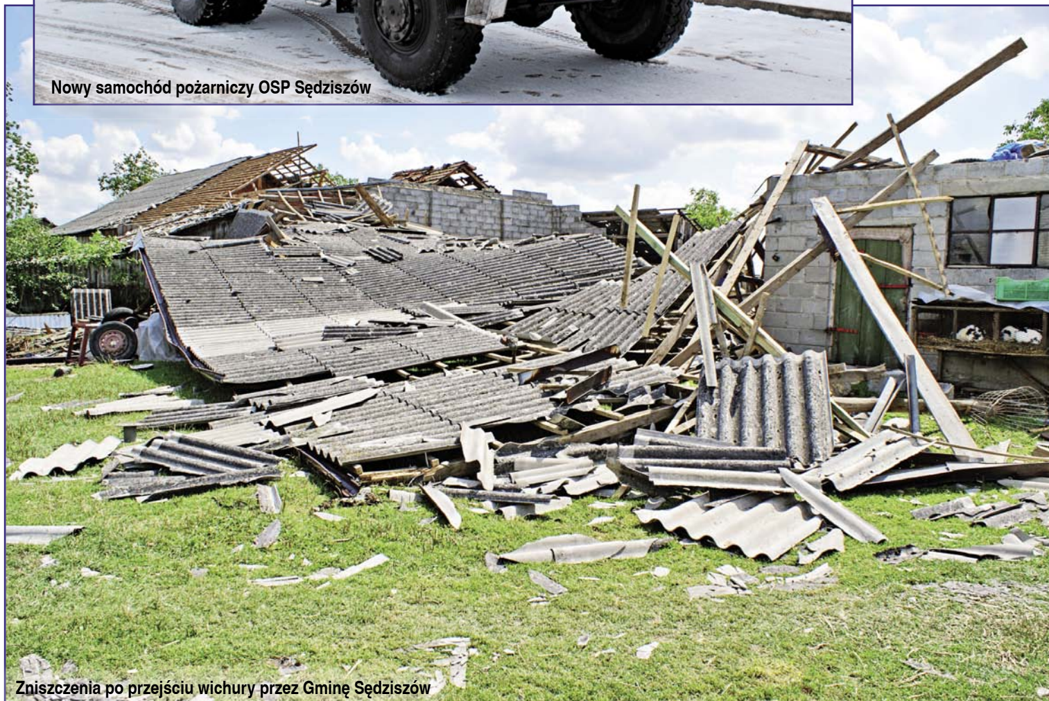
Zniszczenia po przejściu wichury przez Gminę Sędziszów