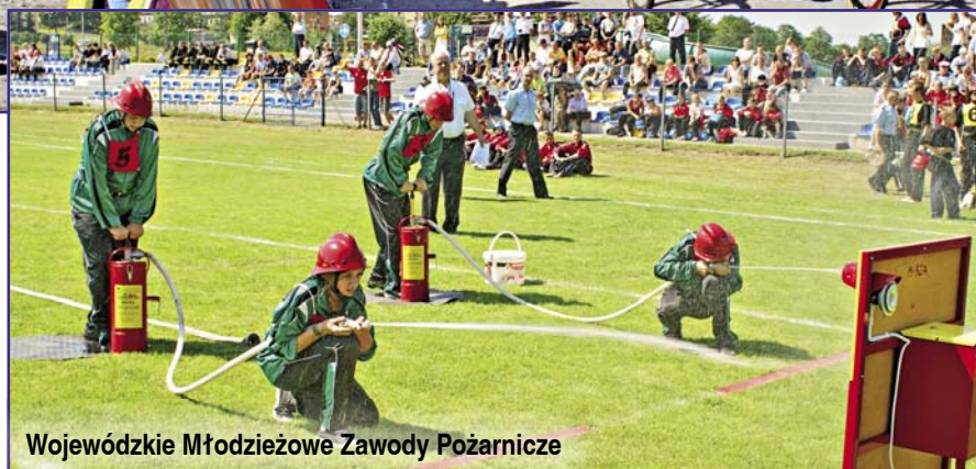
Wojewódzkie Młodzieżowe Zawody Pożarnicze