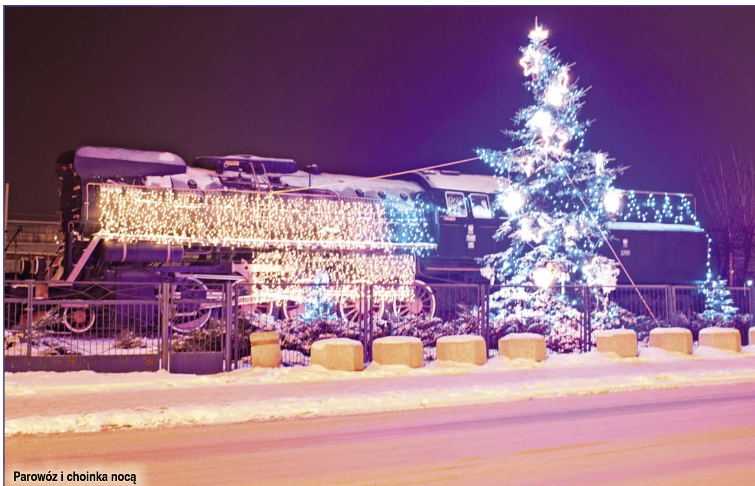
Parowóz i choinka nocą