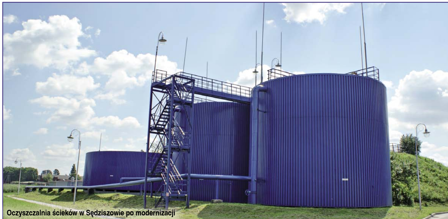
Oczyszczalnia ścieków w Sędziszowie po modernizacji

Zakończono zadanie budowy kanalizacji realizowane w latach 2009 – 2011 w trzech poddziałaniach dotyczące budowy sieci sanitarnej i deszczowej w Sędziszowie, Borszowicach i Tarnawie oraz przebudowy oczyszczalni ścieków w Sędziszowie.