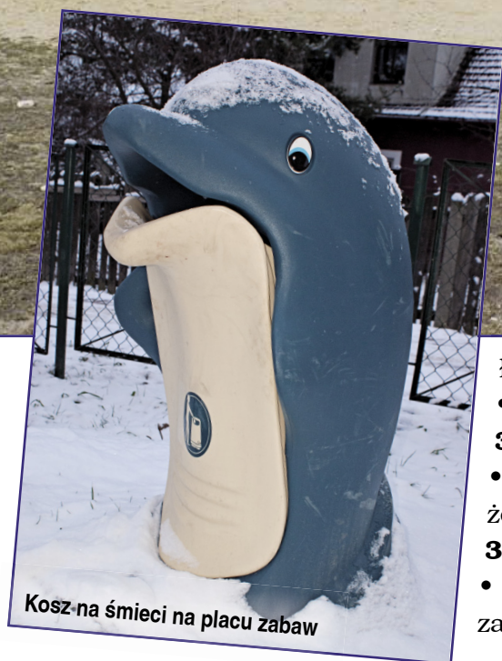
Kosz na śmieci na placu zabaw

ławek stalowo – drewnianych za ogólną kwotę 19.999 zł