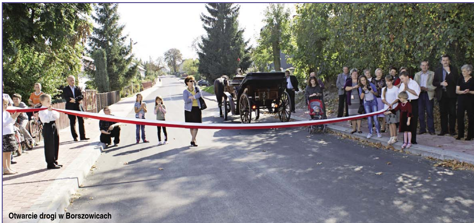
Otwarcie drogi w Borszowicach

Drogownictwo należało w dwóch ostatnich latach do zadań priorytetowych z efektami: