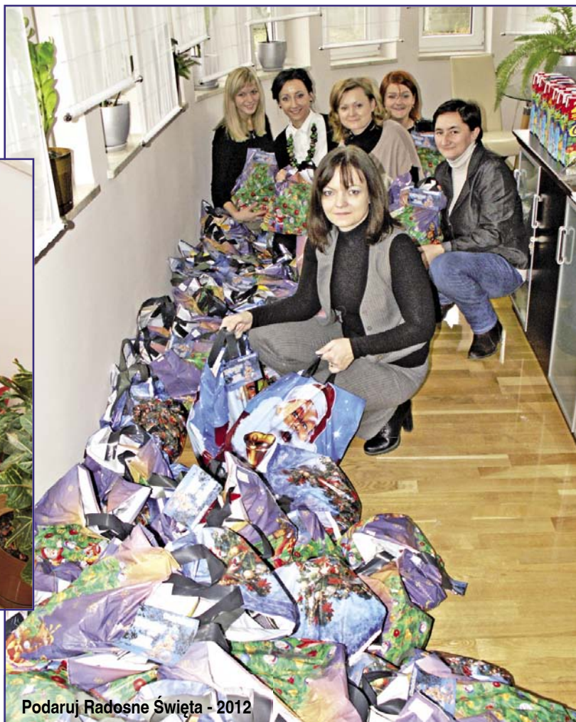
Podaruj Radosne Świąta - 2012