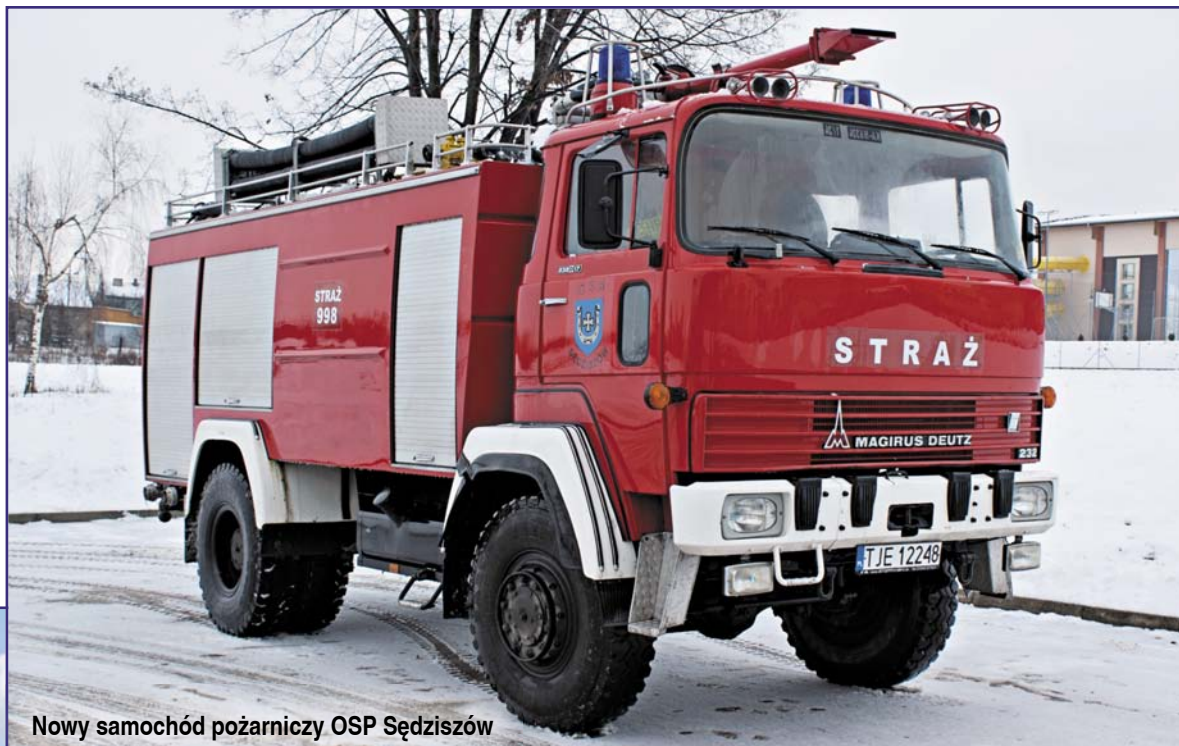
Nowy samochód pożarniczy OSP Sędziszów

Druhowie strażacy na realizację swoich zadań pozyskali środki z zewnątrz w wysokości 37.940 zł .