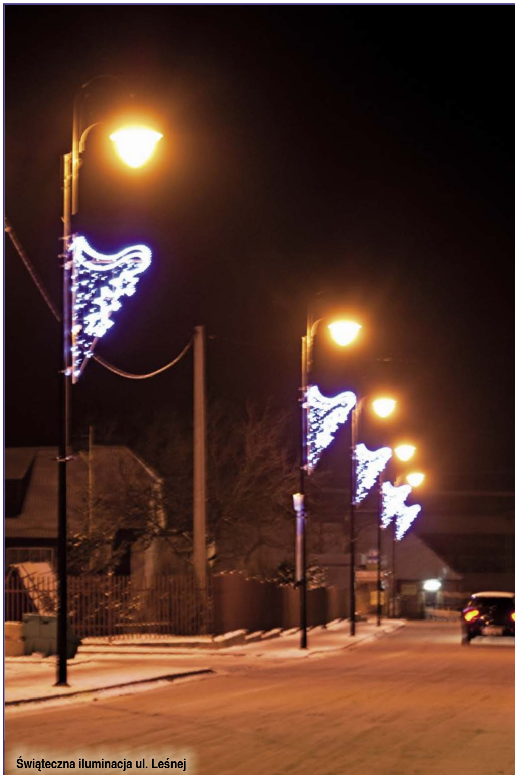
Świąteczna iluminacja ul. Leśnej

Oświetlenie dróg, ulic, placów publicznych czy osiedli to bezpieczeństwo mieszkańców w szerokim tego słowa znaczeniu: