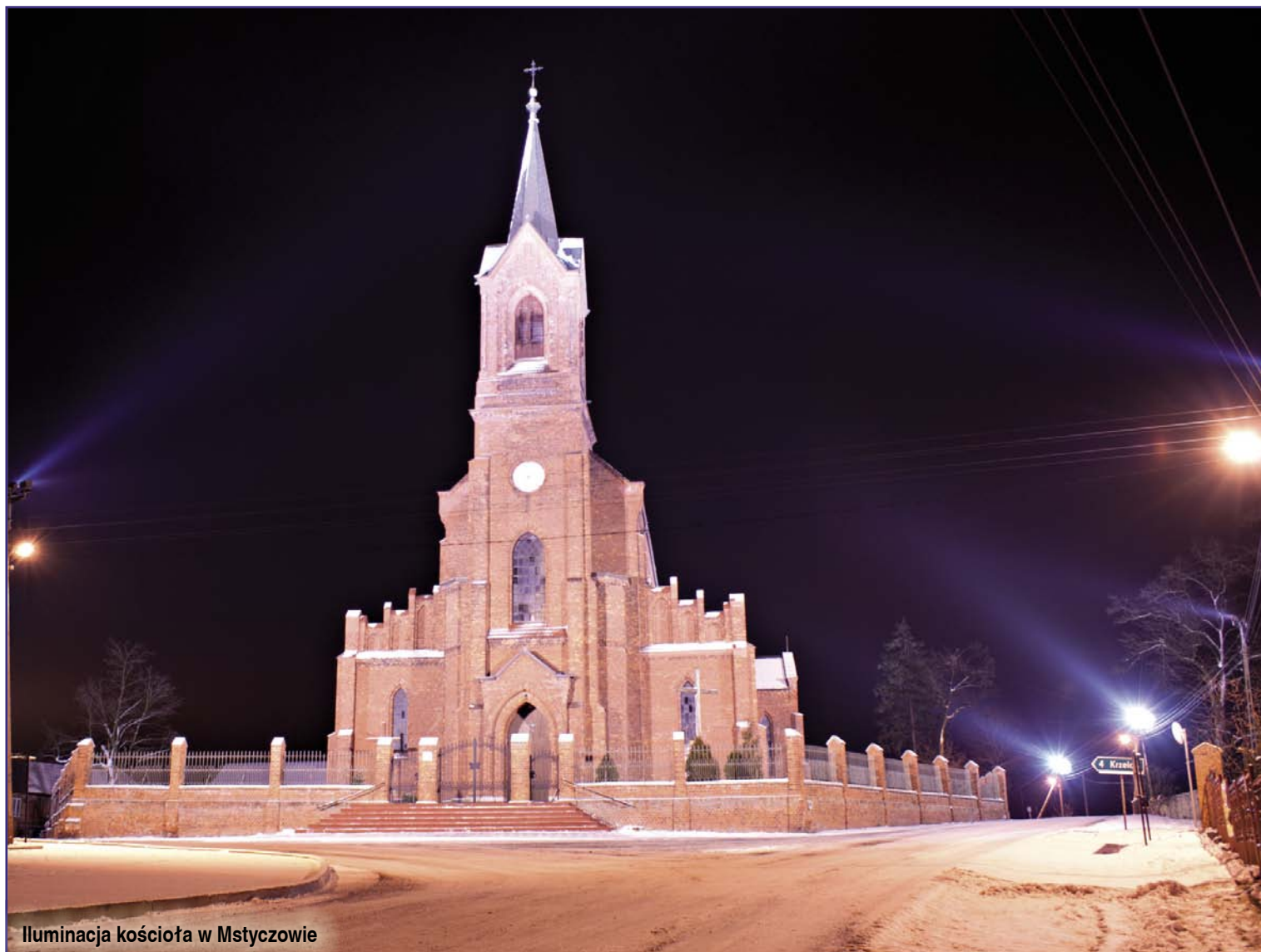
Iluminacja kościoła w Mstyczowie