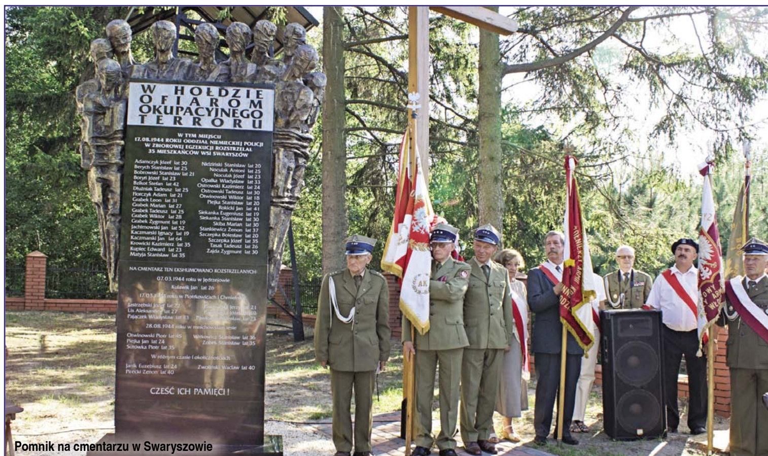
Pomnik na cmentarzu w Swaryszowie

Prowadzono pielęgnację i remonty grobów na cmentarzach w: Sędziszowie, Tarnawie, Mstyczowie i Krzęcicach. Wydatki na ten cel za dwa lata wyniosły kwotę 41.012 zł .