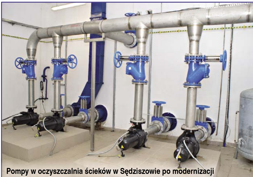
Pompy w oczyszczalni ścieków w Sędziszowie po modernizacji