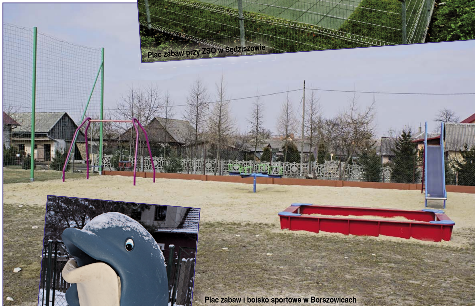
Plac zabaw i boisko sportowe w Borszowicach