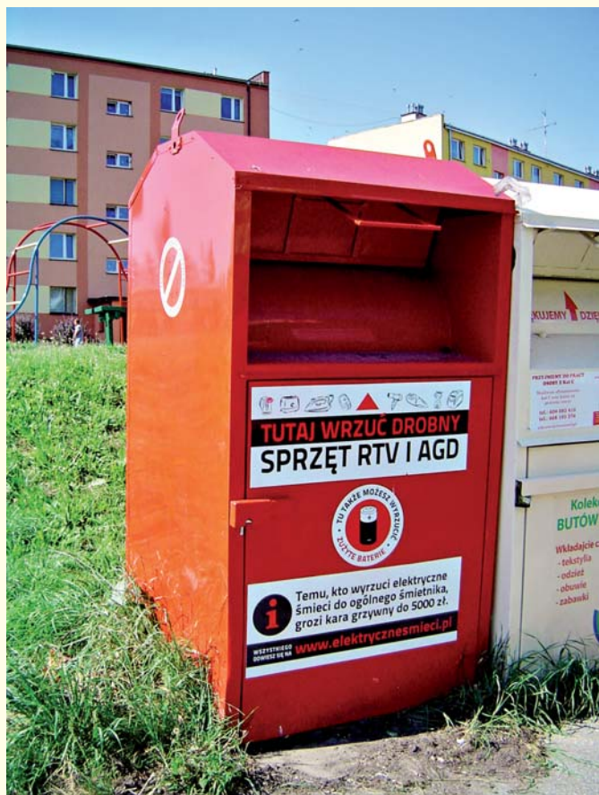
Kosz na elektrośmieci ustawiony w Sędziszowie

Inne zagadnienie to dostosowanie harmonogramów wywozu. Na początku było z tym sporo bałaganu. Myślę, że kolejny miesiąc usprawni sytuację. Firma wywozowa miała czas na zapoznanie się ze specyfiką każdej wsi i została zobowiązana do dostosowania harmonogramów odbioru odpadów komunalnych z terenów zamieszkałych i niezamieszkałych aby nie było sytuacji pozostawienia ich nie odebranych. Jak wynika z przeprowadzonych rozmów z przedstawicielem firmy, mogą one w niewielkim stopniu ulec zmianie o czym Państwo zostaniecie poinformowani przez Firmę „TAMAX” poprzez włożenie zawiadomień do pojemnika. Prosimy o śledzenie ogłoszeń i harmonogramów wywozu, a my nagłośnimy temat na str. Internetowej Gminy.