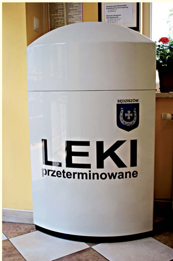
Takie kosze zostały zainstalowane w aptekach