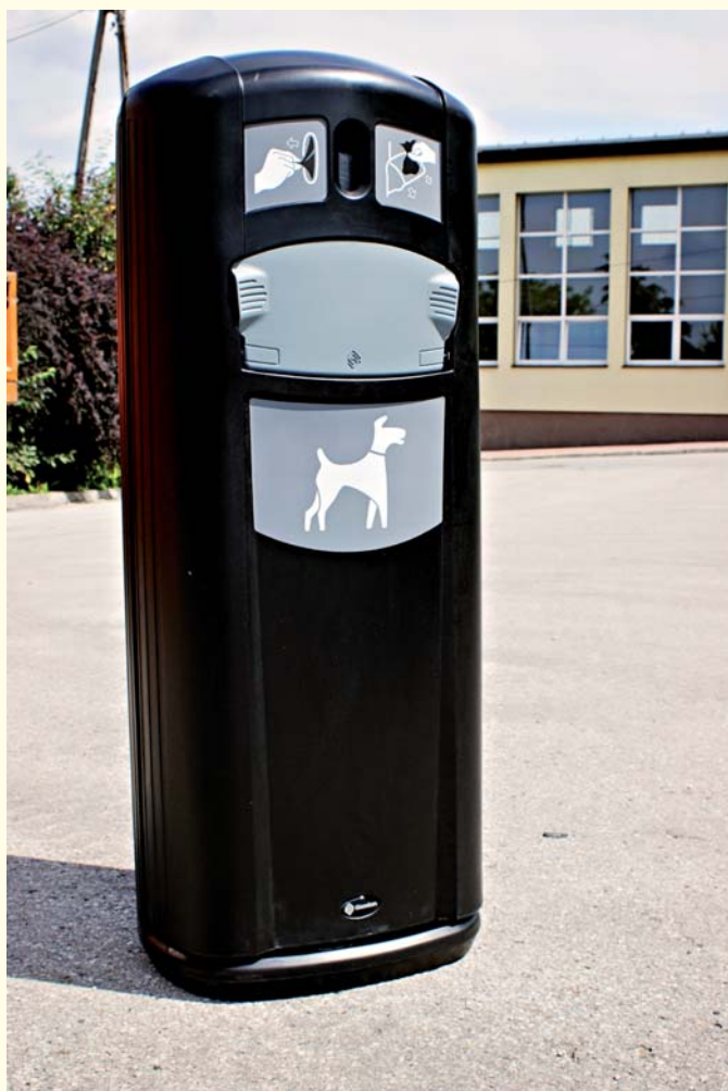
Już niedługo takie kosze zostaną ustawione na terenie Sędziszowa

HB: Największym mankamentem dla mieszkańców jest brak wystarczającej liczby pojemników na odpady, w tym również worków. Firma wywozowa