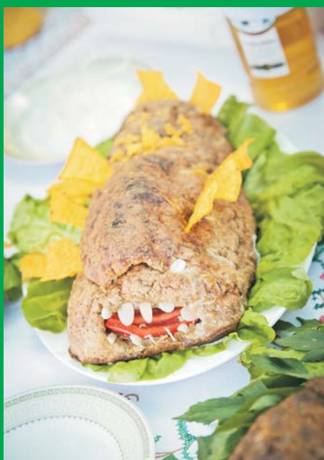
„Paszczka rekina” potrawa konkursowa