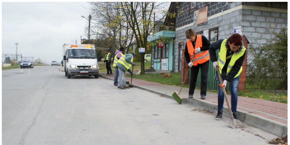
Prace porządkowe na terenie gminy są bardzo przyjaźnie przyjmowane przez mieszkańców. Większość z nich jest wykonywana w ramach środków na zwalczania bezrobocia.

Przypomnijmy że systematycznie od 4 lat Ośrodek Pomocy Społecznej w ramach aktywizacji społecznej i zawodowej osób korzystających z pomocy społecznej rea-