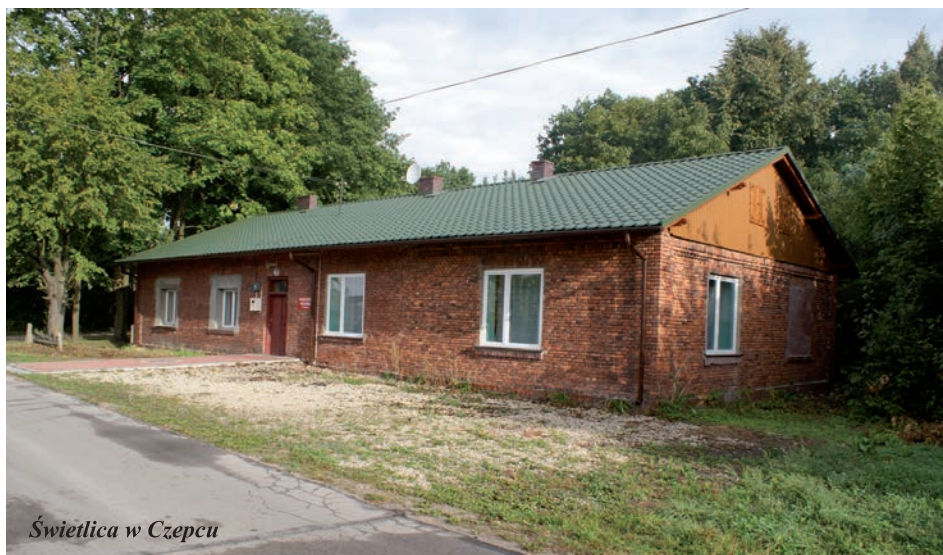
Świątelnia w Czepcu

Dobrze też w roku bieżącym zamknęły się prace na drogach powiatowych, do których przekazaliśmy dotację dla powiatu, w wysokości 250 tys. zł. ZDP położył 5370 mb asfaltu na drodze Krzelów – Przełaj (przez cegielnię), oraz wybudował 3 odcinki chodników: na ul. Gródek dł. 104 mb, na ul. Jędrzejowskiej dł. 248 mb, i w Pawłowicach 124 mb wraz z krytym rowem. Powiat zakończył także odbudowę mostu na drodze Mstyczów – Karczowice i przygotowuje dokumentację na odbudowę