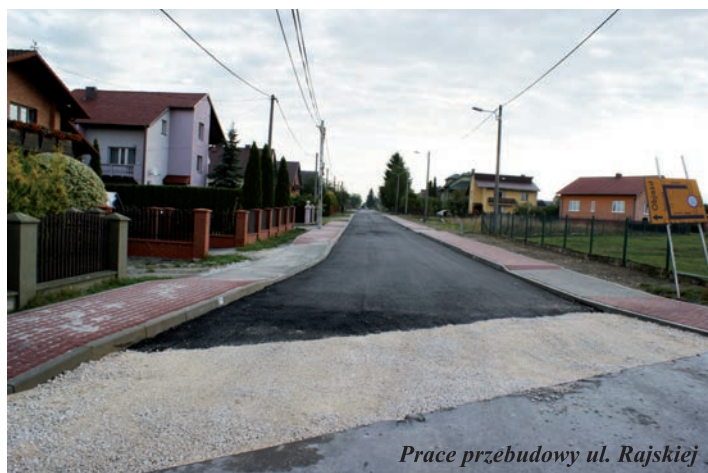
Prace przebudowy ul. Rajskiej