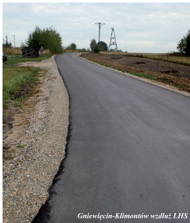
Gniewice-Klimontów wzdłuż LHS

W roku bieżącym ze względów planistycznych nie rozpoczniemy rozbudowy urzędu, to też poważne zmartwienie.