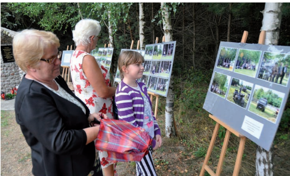
Wystawa z rekonstrukcji historycznej z 2014 roku