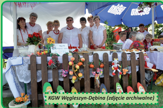
KGW Węgleszyn-Dębina (zdjęcie archiwalne)