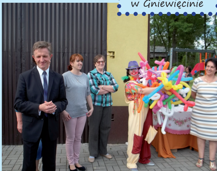
Dzień Dziecka w Gniewiecinie