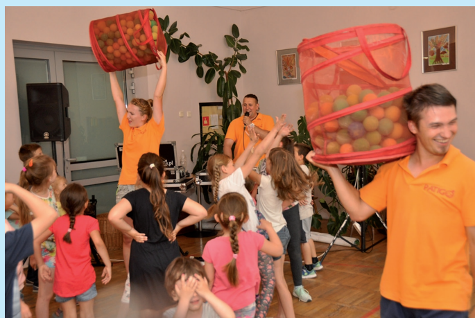
Dzień Dziecka na osiedlu Sady