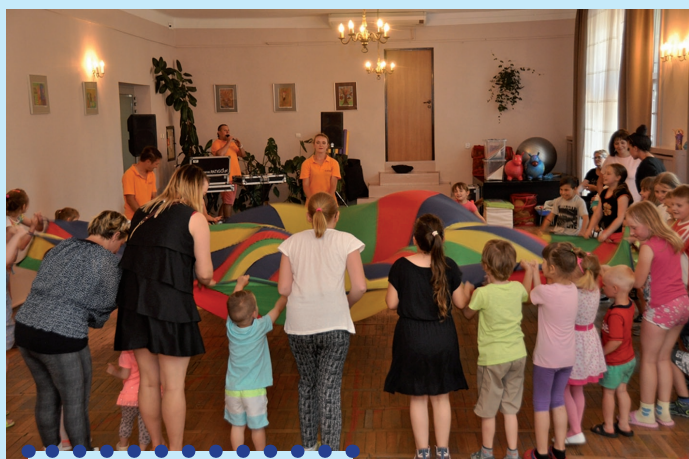
Dzień Dziecka w SCK