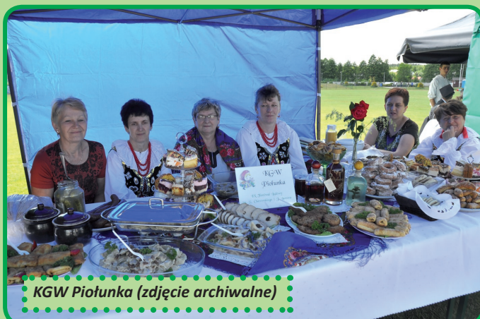
KGW Piotunka (zdjęcie archiwalne)