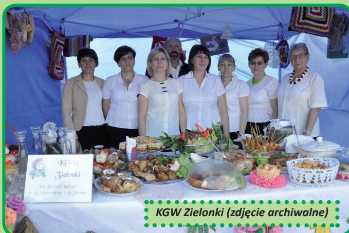
KGW Zielonki (zdjęcie archiwalne)