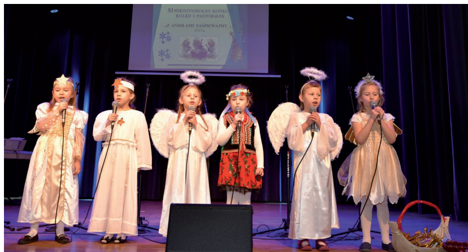
Aniołki z Przedszkola Samorządowego w Sędziszowie

Organizatorzy składają serdeczne podziękowania wszystkim sponsorom. Ten konkurs odbywa się dzięki Wam, Waszej dobroci. Jesteście, Szanowni Państwo, mecenasami kultury w naszej gminie.