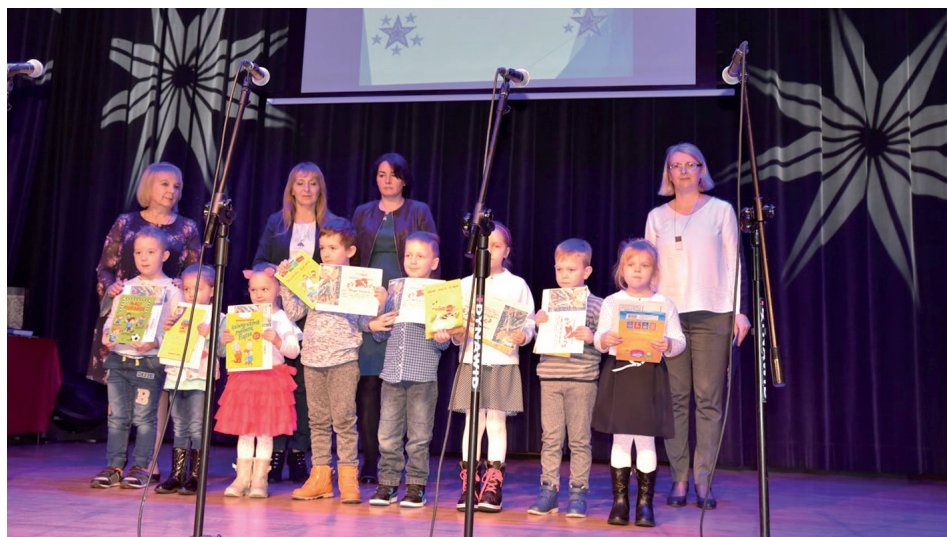
Najmłodsi laureaci konkursu, fot. Jolanta Wiekiera

Uroczysta gala wręczenia nagród laureatom konkursu odbyła się w dniu 10 stycznia 2019 r. w Samorządowym Centrum Kultury w Sędziszowie. Każdy uczestnik konkursu otrzymał nagrodę i dyplom, a nauczyciele – podziękowania. Nagrody, dyplomy i podziękowania wręczyli: wicedyrektor Zespołu Szkół Ogólnokształcących