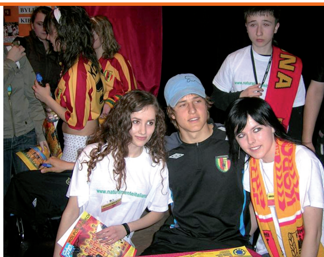
Spotkanie z piłkarzami Korony Kielce