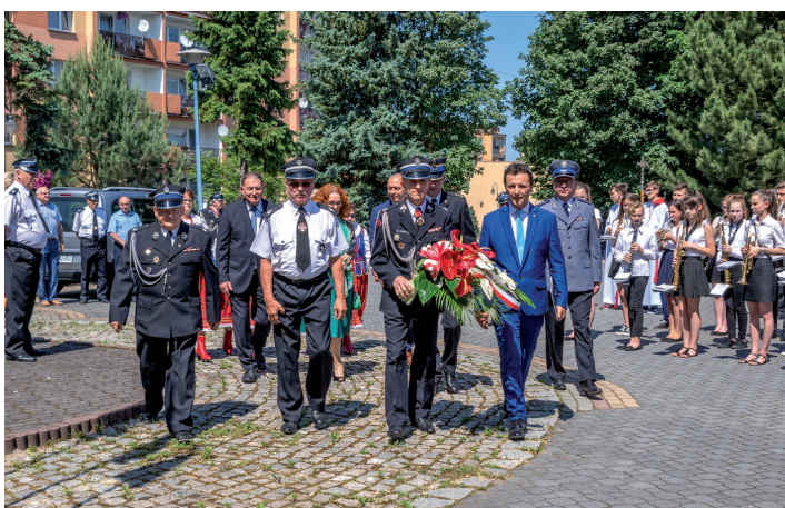
Kwiaty i znicz dla Św. Jana Pawła II