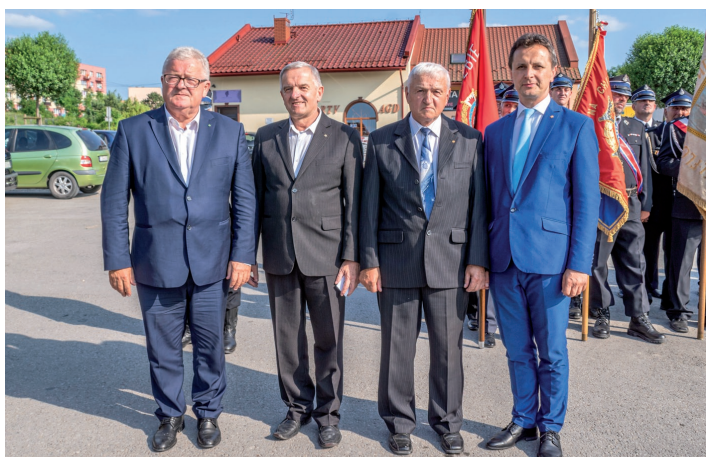
Odznaczenie „Złotą Koniczynką”