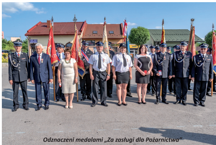
Odnaczeni medalami „Za zasługi dla Pożarnictwa”

Następnie uczestnicy uroczystości przeszli na plac targowy gdzie miał miejsce uroczysty apel, który rozpoczęło złożenie raportu, wyniesienie flagi narodowej