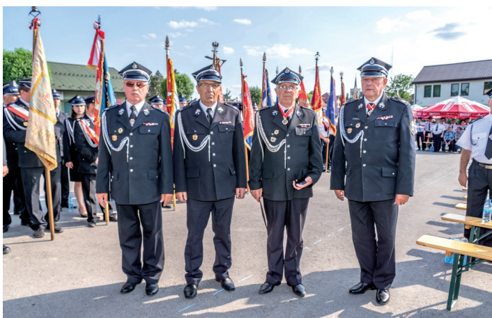
Odznaczenie „Medalem Honorowym im. Bolesława Chomicza”