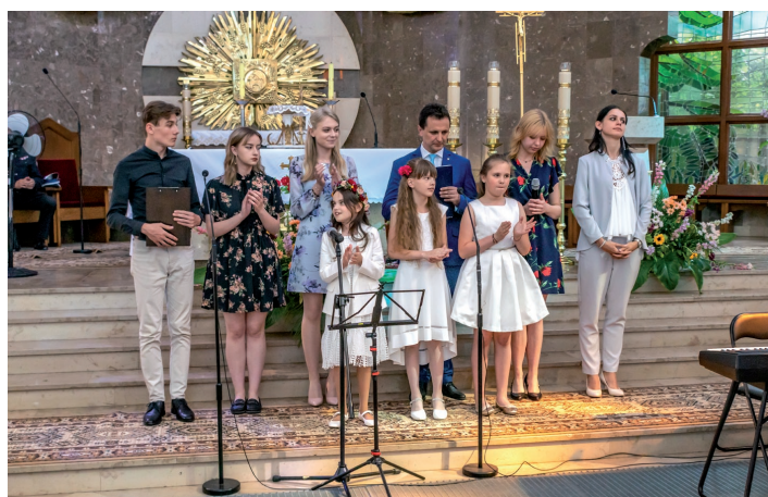
Koncert Pieśni Maryjnej

Spółdzielnia Socjalna „Przysmak” w Sędziszowie po raz pierwszy wzięła udział w „Lokalnym Kiermaszu Ekonomii Społecznej” organizowanym przez Świętokrzyski Ośrodek Wsparcia Ekonomii Społecznej, który odbył się w dniu 11 czerwca 2019 roku w Centrum Kultury w Jędrzejowie, Al. J. Piłsudskiego 3.