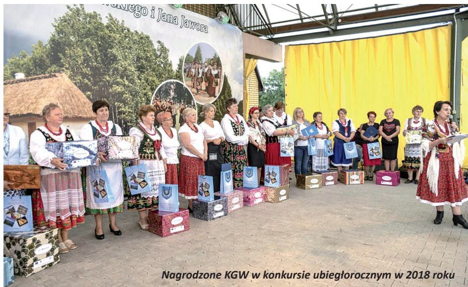
Nagrodzone KGW w konkursie ubiegłorocznym w 2018 roku

Instytucja Zarządzająca Programem Rozwoju Obszarów Wiejskich na lata 2014-2020 - Minister Rolnictwa i Rozwoju Wsi