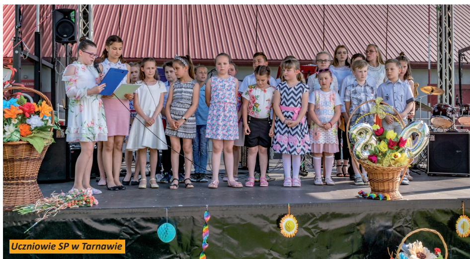
Uczniowie SP w Tarnawie

- rok 2012 był dla nich szczególnie, spadł deszcz kolejnych nagród. Były to: pierwsza nagroda - specjalna od Euro-