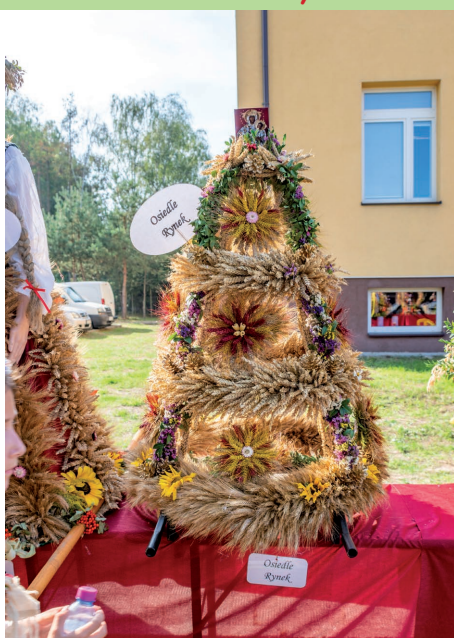
KGW Osiedle Rynek