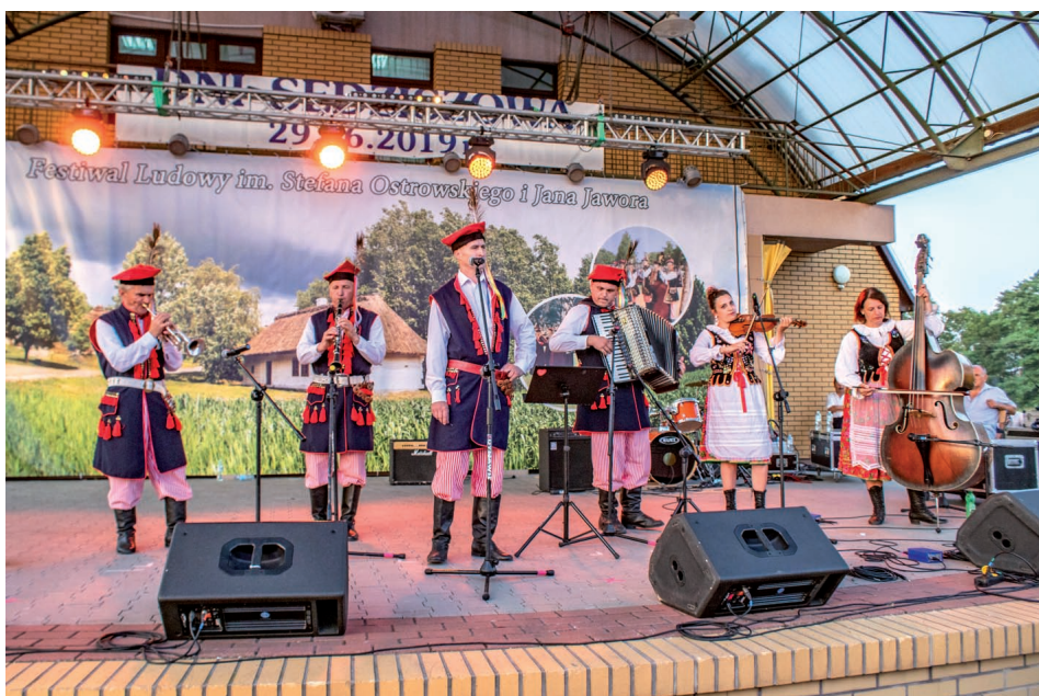
Nagroda za najładniejsze stoisko przypadła dla KGW Marianów.