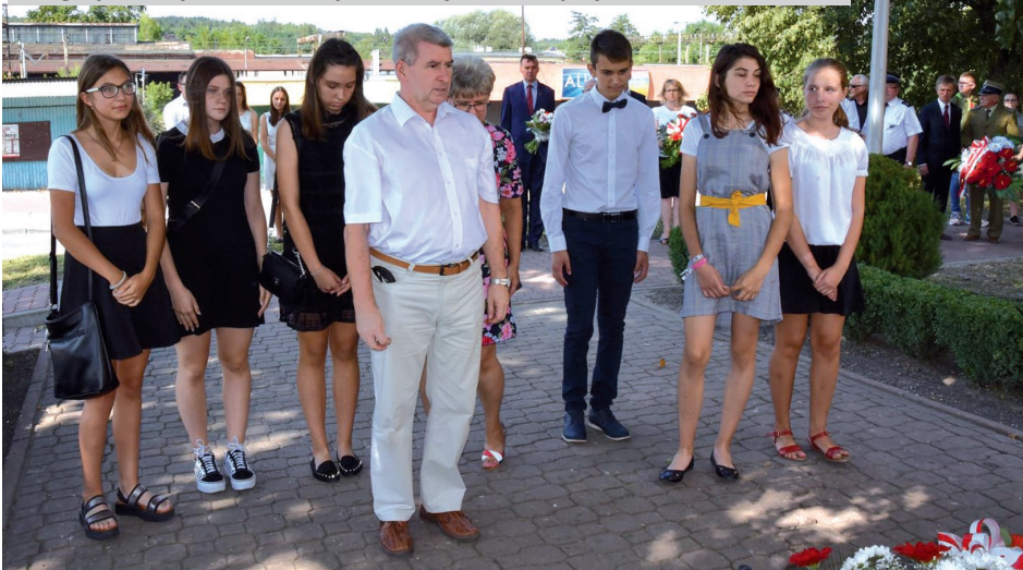
Delegacja Szkoły Podstawowej Nr 2 w Sędziszowie przy SCK im. Jana Pawła II