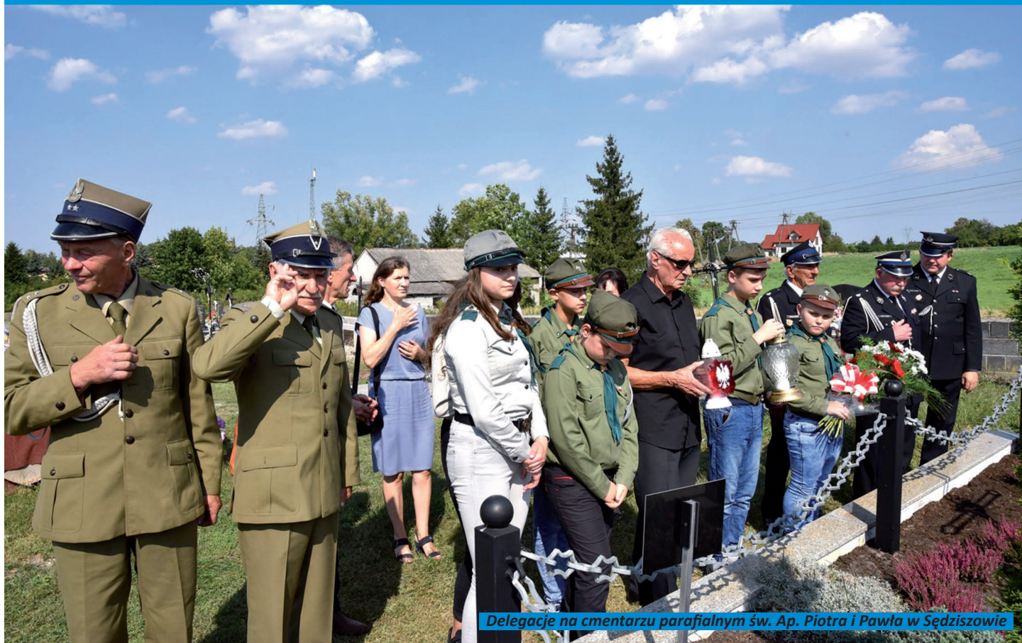
Delegacje na cmentarzu parafialnym św. Ap. Piotra i Pawła w Sędziszowie