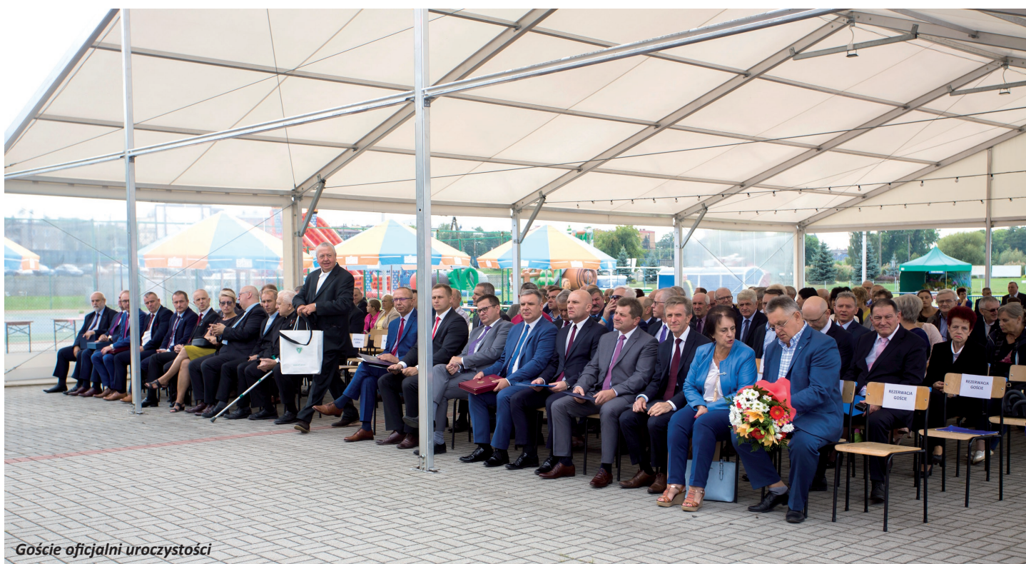
Goście oficjalni uroczystości