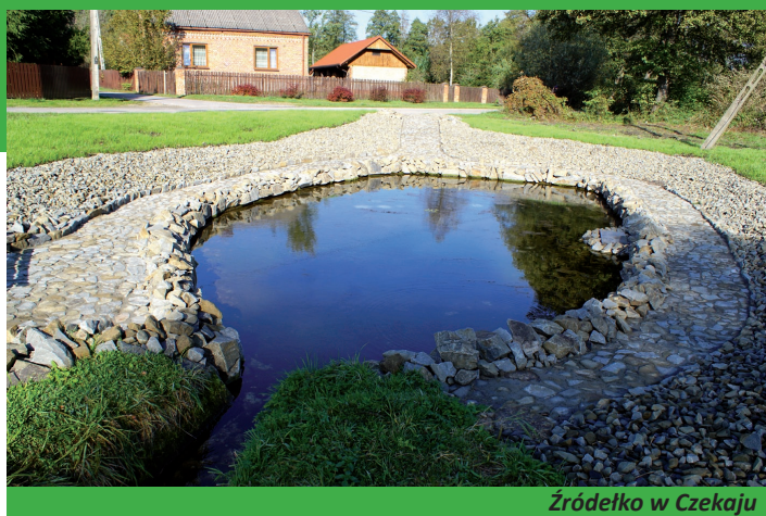
Źródło w Czekaju