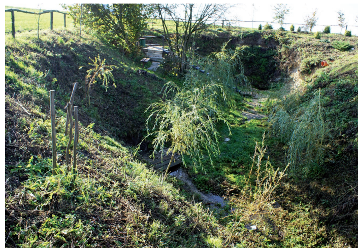
Źródło w Gniewięcinie