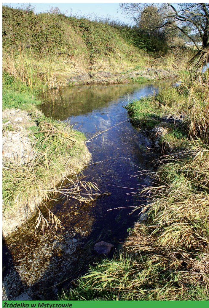
Źródło w Mstyczowie